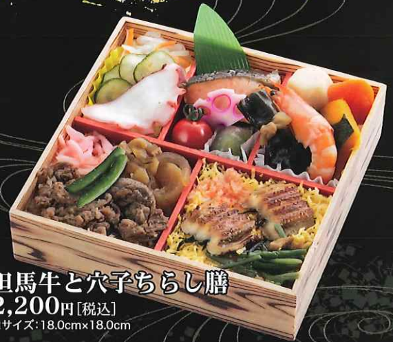
但馬牛と穴子ちらし膳 2,200円[税込] ■サイズ:18.0cm×18.0cm