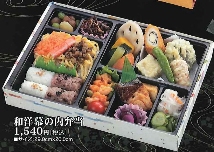
和洋幕の内弁当 1,540円[税込] ■サイズ:29.0cm×20.0cm