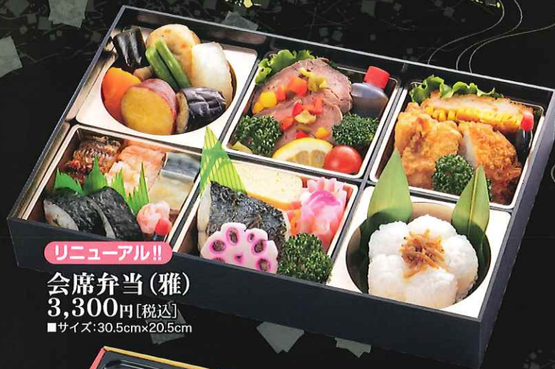
リニューアル!! 会席弁当(雅) 3,300円[税込] ■サイズ:30.5cm×20.5cm