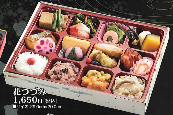
花つづみ 1,650円[税込] ■サイズ:29.0cm×20.0cm