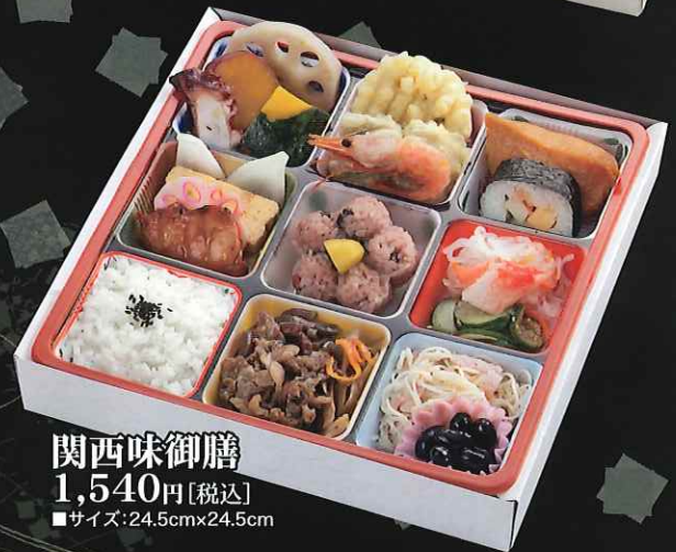
関西味御膳 1,540円[税込] ■サイズ:24.5cm×24.5cm