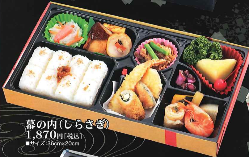
幕の内(しらさぎ) 1,870円[税込] ■サイズ:36cm×20cm