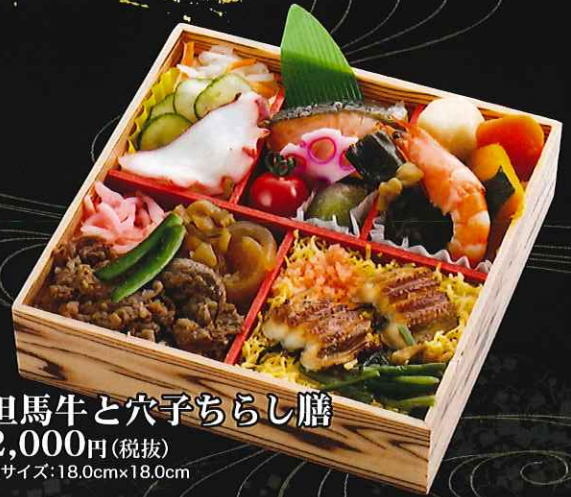
但馬牛と穴子ちらし膳 2,000円(税抜) ■サイズ:18.0cm×18.0cm