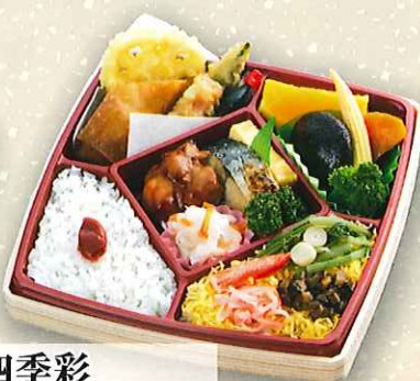
四季彩 900円(税抜) ■サイズ:19.0cm×19.0cm