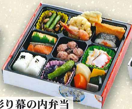
彩り幕の内弁当 950円(税抜) ■サイズ:21.5cm×21.5cm