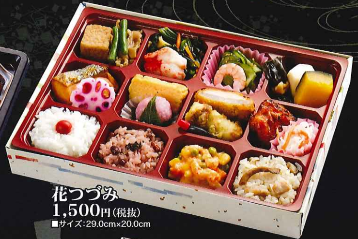
花つづみ 1,500円(税抜) ■サイズ:29.0cm×20.0cm