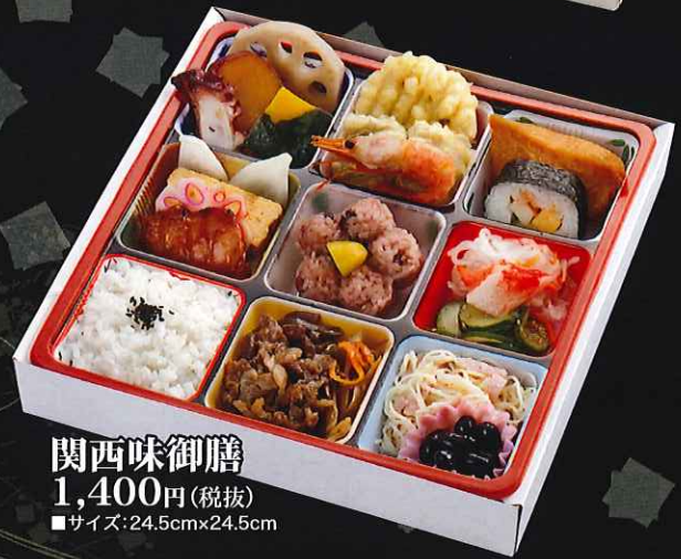
関西味御膳 1,400円(税抜) ■サイズ:24.5cm×24.5cm