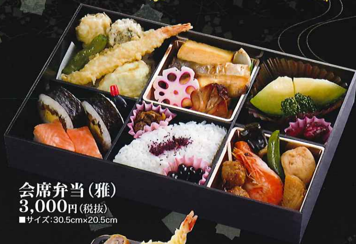
会席弁当(雅) 3,000円(税抜) ■サイズ:30.5cm×20.5cm