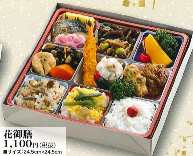
花御膳 1,100円(税抜) ■サイズ:24.5cm×24.5cm