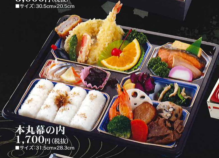
本丸幕の内 1,700円(税抜) ■サイズ:31.5cm×28.3cm