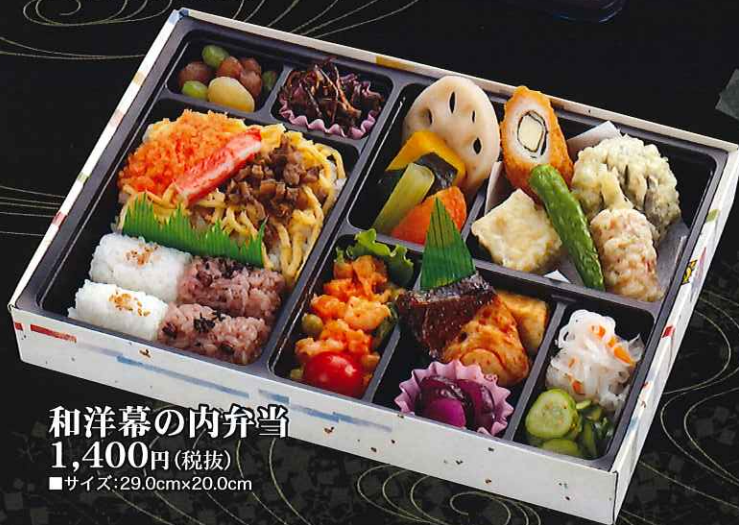
和洋幕の内弁当 1,400円(税抜) ■サイズ:29.0cm×20.0cm