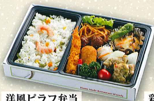
洋風ピラフ弁当 950円(税抜) ■サイズ:27.5cm×18.0cm