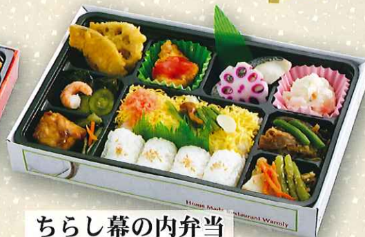
ちらし幕の内弁当 950円(税抜) ■サイズ:27.5cm×18.0cm