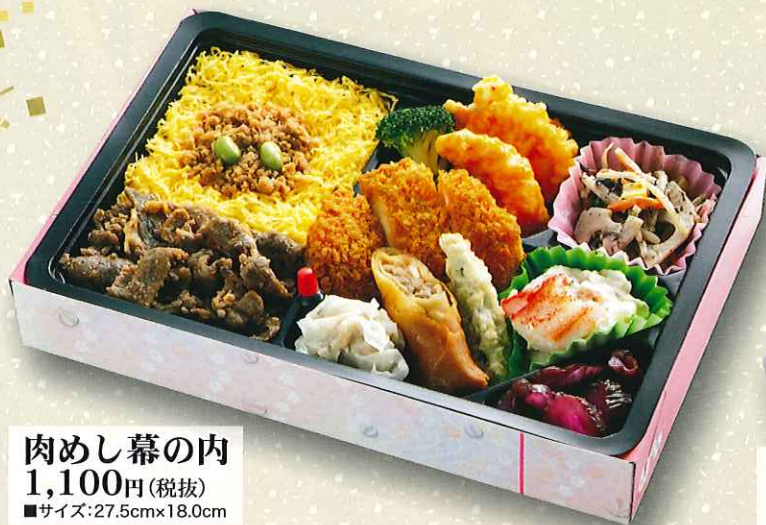
肉めし幕の内 1,100円(税抜) ■サイズ:27.5cm×18.0cm