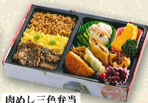
肉めし三色弁当 800円(税抜) ■サイズ:24.5cm×16.5cm