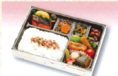
No. 611 和風弁当 24.2×16.5cm 850円 + 消費税