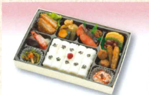
No. 607 幕の内弁当 27.6×18.2cm 1,000円 + 消費税