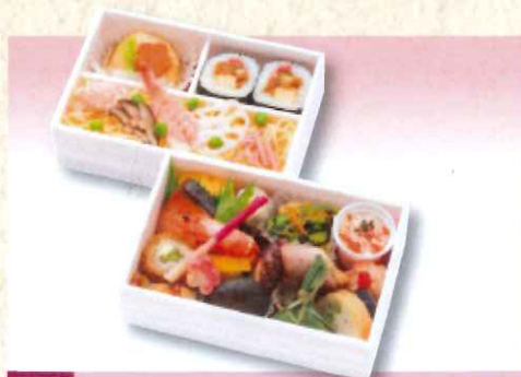
No. 627 みやび 17.0×11.3cm 2,000円 + 消費税