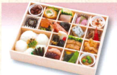
No. 626 六斎 24.0×18.5cm 2,000円 + 消費税