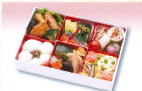
No. 601 花かすり 25.0×17.0cm 1,500円 + 消費税