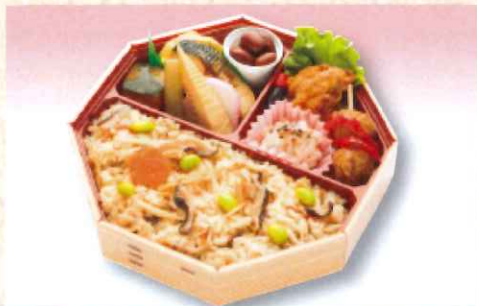
No. 613 炊き込みごはん 弁当 20.5×20.5cm 800円 + 消費税