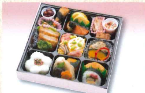
No. 603 花こもん 25.0×25.0cm 1,300円 + 消費税