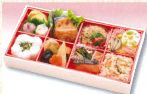
No. 606 すみれ 30.0×16.0cm 1,200円 + 消費税