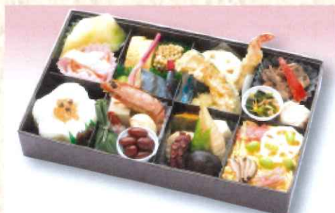
No. 623 なごみ 28.6×17.2cm 2,500円 + 消費税