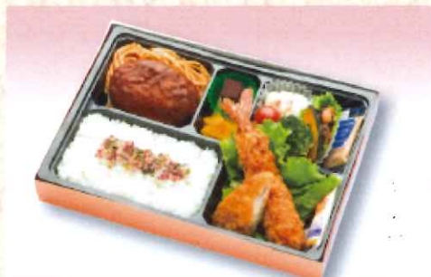
No. 608 洋風 幕の内弁当 27.5×19.0cm 1,000円 + 消費税