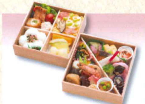
No. 625 円山 16.3×16.3cm 2,300円 + 消費税