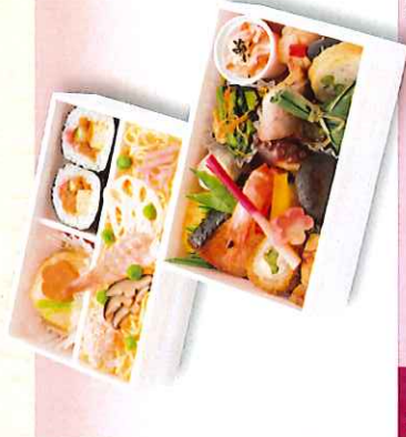
No. 627 みやび 17.0×11.3cm 2,000円 + 消費税