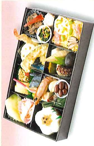
No. 623 なごみ 28.6×17.2cm 2,500円 + 消費税