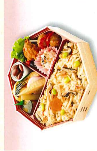
No. 613 炊き込みごはん 弁当 20.5×20.5cm 800円 + 消費税