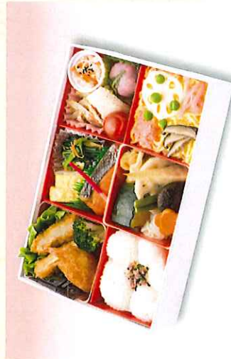
No. 601 花かすり 25.0×17.0cm 1,500円 + 消費税