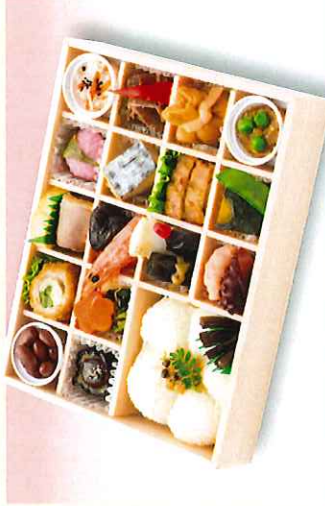
No. 626 六斎 24.0×18.5cm 2,000円 + 消費税