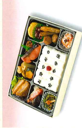
No. 607 幕の内弁当 27.6×18.2cm 1,000円 + 消費税