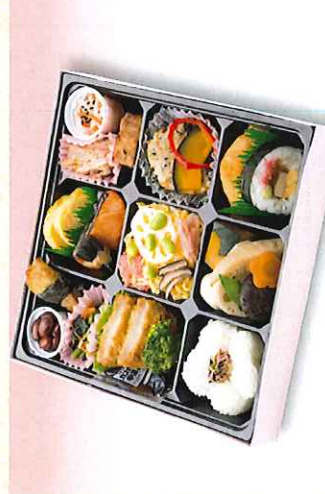
No. 603 花こもん 25.0×25.0cm 1,300円 + 消費税