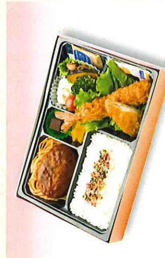
No. 608 洋風 幕の内弁当 27.5×19.0cm 1,000円 + 消費税