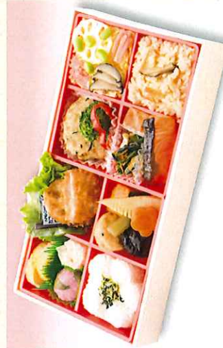
No. 606 すみれ 30.0×16.0cm 1,200円 + 消費税