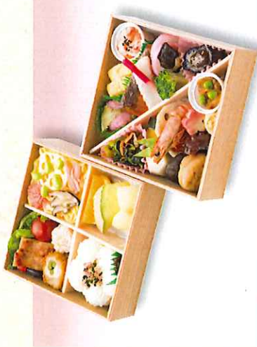
No. 625 円山 16.3×16.3cm 2,300円 + 消費税