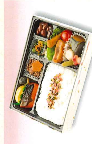
No. 611 和風弁当 24.2×16.5cm 850円 + 消費税